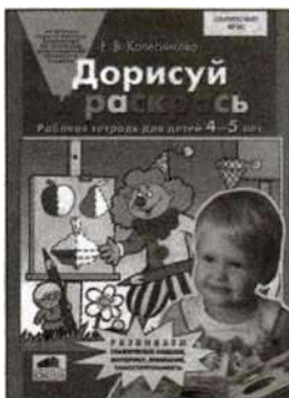
«Дорисуй и раскрась». Рабочая тетрадь для детей 4—5 лет.