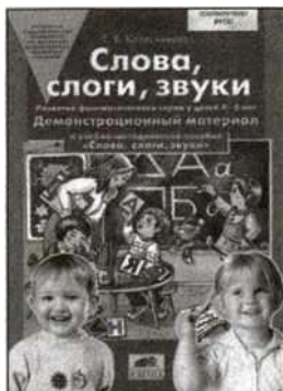
«Слова, слоги, звуки». Демонстрационный материал для занятий с детьми 4—5 лет.