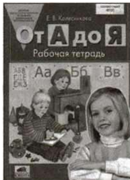
«От А до Я». Рабочая тетрадь для детей 5—6 лет.