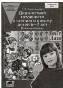
«Диагностика готовности к чтению и письму детей 6—7 лет». Рабочая тетрадь.