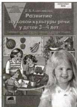
«Развитие звуковой культуры речи у детей 3—4 лет». Учебно-методическое пособие.