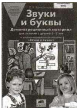
«Звуки и буквы». Демонстрационный материал для занятий с детьми 5—6 лет.