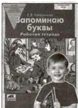
«Запоминаю буквы». Рабочая тетрадь для детей 5—7 лет.