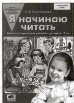
«Я начинаю читать». Рабочая тетрадь для детей 6—7 лет.