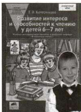
«Развитие интереса и способностей к чтению у детей 6—7 лет». Учебно-методическое пособие.