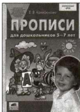
«Прописи для дошкольников 5—7 лет».