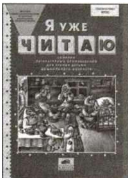
«Я уже читаю». Сборник литературных произведений для детей 4—7 лет.