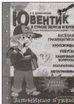
«Ювентик в стране звуков и букв». Рабочая тетрадь для детей 5—7 лет.