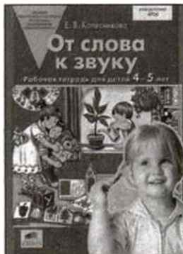
«От слова к звуку». Рабочая тетрадь для детей 4—5 лет.