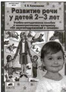
«Развитие речи у детей 2—3 лет». Учебно-методическое пособие к иллюстративному материалу «От звукоподражаний к словам».