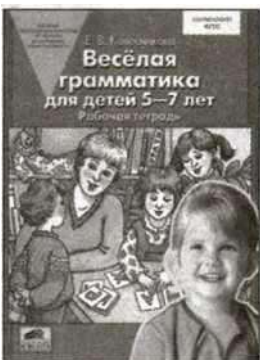
«Веселая грамматика для детей 5—7 лет». Рабочая тетрадь.