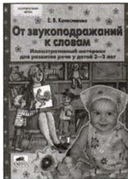
«От звукоподражаний к словам». Иллюстративный материал для развития речи у детей 2—3 лет.