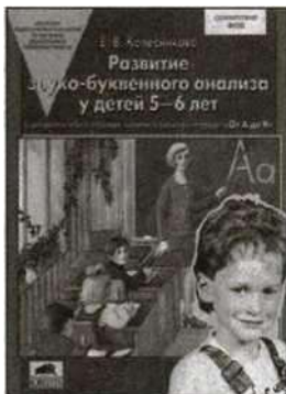
«Развитие звуко- буквенного анализа у детей 5—6 лет». Учебно-методическое пособие.