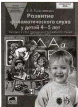
«Развитие фонематического слуха у детей 4—5 лет». Учебно-методическое пособие.