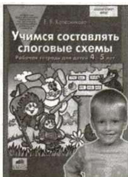
«Учимся составлять слоговые схемы». Рабочая тетрадь для детей 4—5 лет.

Используйте данные пособия только после того, как закончите обучение детей по книгам основного комплекта.