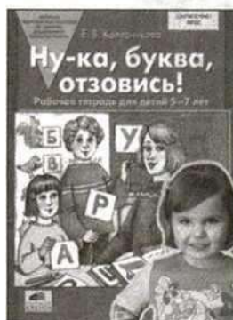
«Ну-ка, буква, отзовись!» Рабочая тетрадь для детей 5—7 лет.