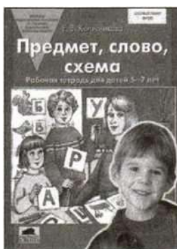
«Предмет, слово, схема». Рабочая тетрадь для детей 5—7 лет.

Преимущества такого авторского подхода очевидны, так как создают возможность: