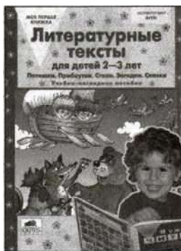
«Литературные тексты для детей 2—3 лет». Учебно-наглядное пособие.