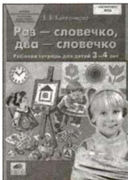
«Раз — словечко, два — словечко». Рабочая тетрадь для детей 3—4 лет.